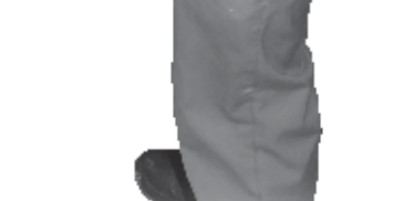
Salario de operario