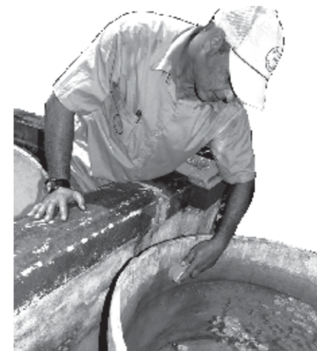
Bazoooka TF- 34