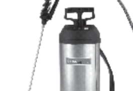
Aspersor M. Cleaner